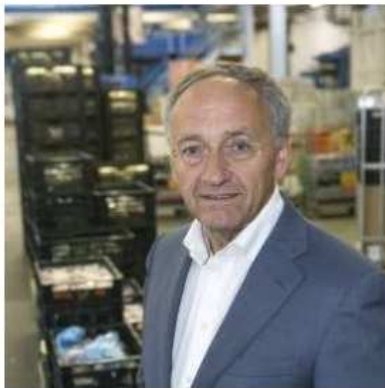
e-commerce

Amper een jaar geleden zette Leen Menken de eerste voorzichtige schreden op het glibberige e-commerce pad. Inmiddels weet de oprichter/directeur dat daar de toekomst ligt. Nieuwe klanten helpen Menken om uit te groeien tot een grote dienstverlener in de fijnmazige distributie voor webshops.