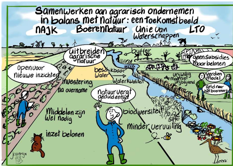
Illustratie 1: Samenwerken voor agrarisch ondernemen in balans met natuur: een toekomstbeeld (illustrator: Jessamijn Alberts)

Jessamijn Alberts vatte de input van de deelnemers samen in twee illustraties.