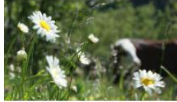
50 tinten groen in een kleinschalig cultuurlandschap