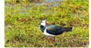
Vergroening van de melkveehouderij