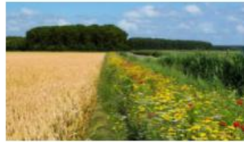
LTO sectorale bouwstenen