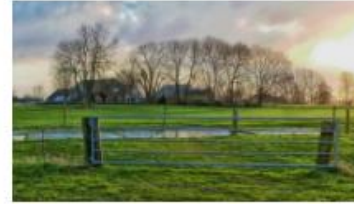
Vergroening waterrijke veenweidegebieden